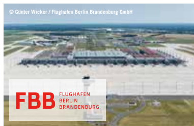
Flughafen Berlin Brandenburg Schönefeld

In dem aufstrebenden Standort für Hightech-Produktion, intelligente Dienstleistungen, Forschung, Entwicklung und Ausbildung arbeiten und forschen mehr als 100 wachstumsstarke Unternehmen und Einrichtungen mit mehr als 2.000 hochqualifizierten Beschäftigten in den Bereichen Verkehrstechnik, Life Sciences, Energietechnik, optische Technologien, Informationstechnologie, Materialwissenschaften und Astroteilchenphysik.