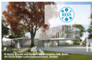
Deutsches Elektronen-Synchrotron (DESY) Zeuthen

Durch Regional-Express und S-Bahn, die Autobahnen A10 und A13 sowie last but not least den zukünftigen Flughafen BER ist die Technologie- und Wissenschaftsregion für Kunden, Beschäftigte und Zulieferer in das Verkehrsnetz der Metropolregion Berlin-Brandenburg und international hervorragend eingebunden.